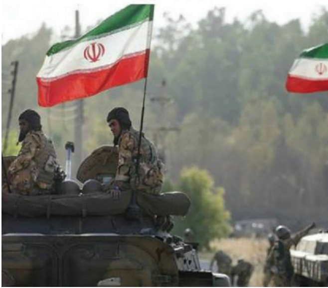
Իրանական զորքը Ադրբեջանի սահմանի մոտ

Ի մի բերելով այս ամենը՝ ցավոք գալիս ենք այն եզրահանգման, որ հարավկովկասյան աշխարհաքաղաքական ներկա զարգացումներում տարածաշրջանային բոլոր երկրները, բացի Հայաստանից, ունեն իրենց շահերի սպասարկման կայուն իրագործվող ծրագրեր, որոնց մի մասն էլ կյանքի է կոչվում ի հաշիվ մեր ազգային շահերի: Հայաստանն ունի բոլորի խաղաքարտերը խառնելու հնարավորություն: Բայց դա դժվար իրագործելի, վտանգավոր սցենար է, որը միանշանակ վեր է այս իշխանությունների կարողություններից: Ավելին՝ ՀՀ իշխանություններն աշխարհաքաղաքական այս բարդ իրավիճակում ստորադասել են հայկական պետությունների շահերն իրենց անձնական քաղաքական հետաքրքրություններին, իսկ հաճախ էլ սպասարկում են թուրք-ադրբեջանական դաշինքի շահերը: Այս ամենը հանգեցրել է նրան, որ հայ ժողովրդին առաջարկվում է բավարարվել իր հնարավորությունների չնչին մասով, չխանգարել այլ երկրների տարածաշրջանային ծրագրերին, չփորձել նույնիսկ մտածել կորցրածը վերականգնելու մասին, լինել գործիք այլոց ձեռքին և շարունակել պահպանել Նիկոլի իշխանությունը: ■