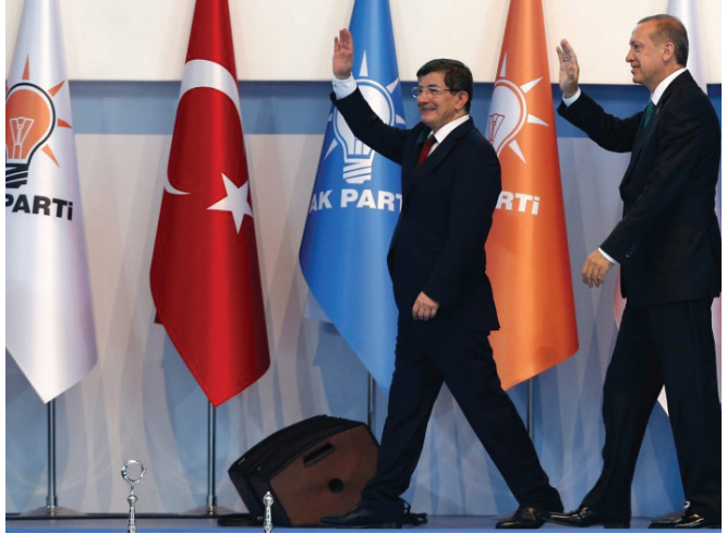
Դավաթողուն և Էրդողանը

2008 թ. մարտի 21-ին աջ ծայրահեղ ազգայնական խմբավորումներից մեկի անդամների ձերբակալմամբ սկիզբ առավ «Էրգենեքոն» գաղտնի կազմակերպության ու դրա գործունեության բացահայտման գործը 41 , որին հաջորդեց ձերբակալությունների 13 ալիք հետագա 4 տարիների ընթացքում 42 : Ձերբակալվեցին ԶՈՒ բարձրագույն և միջին սպայական կազմի, մտավորականության, դատախարակական համակարգի, լրագրության մի քանի հարյուր ներկայացուցիչներ, որոնց անունները այս կամ այն կերպ առնչվում էին գաղտնի կազմակերպություններին, առգրավվեցին մեծաքանակ զենք և զինամթերք, համակարգչային