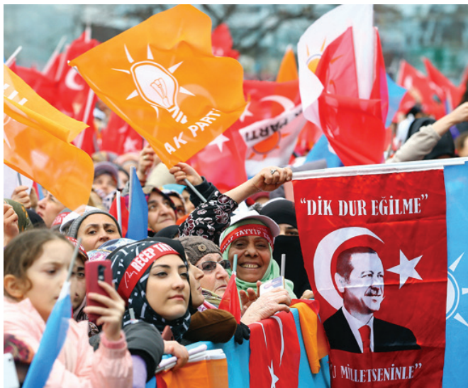
Արդարություն և զարգացում կուսակցության հանրահավաքը

Իշխանության գալով՝ ԱԶԿ-ն սկիզբ դրեց քաղաքական նոր գործելաճի: Էրդողանը որդեգրեց պետության և ժողովրդի միջև գործակցության նոր սկզբունք, ըստ որի՝ պետությունը պետք է վերածել ժողովրդին ու անհատին ծառայություն մատուցող ինստիտուտի՝ վերջ դնելով մինչ այդ գործած հակառակ սկզբունքին 17 : Դրանով պայմանավորված՝