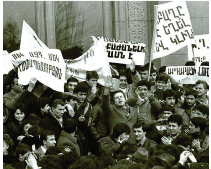
Երևան. Արցախյան շարժում, 1988 թ.

Այս արտաքին երեք ուժերու (Թ-ուրքիա, Ատրպէյճան և Արևմուտք՝ իր լծակից-գործակիցներով) շահերը նոյնացան ընդդէմ Արցախի հարցին ու Հայաստանին, և նոյն այս ուժերն էին (դերերու համապատասխան