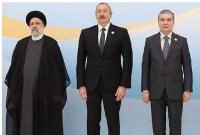
Իրանի, Ադրբեջանի և Թուրքմենստանի նախագահները ստորագրեցին թուրքմենական գազի տարանցման մասին պայմանագիր

Ներկայումս պաշտոնական Թեհրանն ակտիվորեն աշխատում է Ադրբեջանի և Հայաստանի տարածքներով բեռնափոխադրումներ իրականացնելու հնարավորությունները մեծացնելու ուղղությամբ: Կառուցվում են նոր ճանապարհներ, երկաթուղային գծեր և կամուրջներ, վերագինվում սահմանային անցակետերը և այլն: Ավելին՝ իրանական կողմը դիտարկում է նաև Արցախի օկուպացված տարածքներում ներդրումներ անելու հնարավորությունը: Համատեղ համապարփակ աշխատանքների ծրագրի լիարժեք գործողության վերականգնման շուրջ Վիեննայում ներկա ժամանակահատվածում վարվող բանակցությունների հաջող ընթացքը թույլ է տալիս ենթադրել, որ շուտով Իրանը