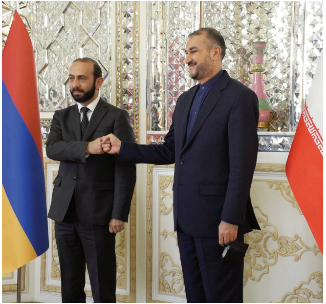
ՀՀ արտգործնախարար Արարատ Միրզոյանը Թեհրանում՝ Իրանի արտգործնախարար Հուսեյն Ամիր Աբդոլսահիանի հետ հանդիպման ժամանակ

Հարավային Կովկասում իր, այսպես կոչված, կարմիր գծերը գծելուց հետո իրանական կողմն առանց ժամանակ կորցնելու անցել է ռազմավարական նշանակություն ունեցող հաջորդ ծրագրի՝ դեպի Սև ծովի ավազան և Արևելյան Եվրոպա տանող կոմունիկացիոն միջանցքի ստեղծման աշխատանքներին: 2021 թ. մարտի 27-ին Իրանի և